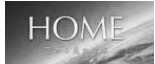
ナレーション：道端ジェシカ