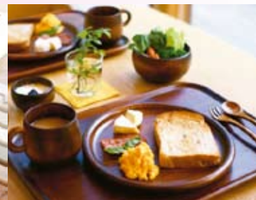
永く遊べる無垢の木のおもちゃと手になじむ扱いやすい漆の器