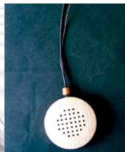
日本の森から生まれたエッセンシャルオイル yuica (ゆいか) と関連木製品