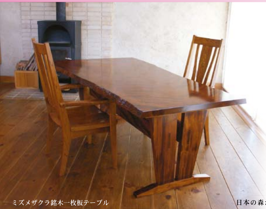
ミズメザクラ銘木一枚板テーブル